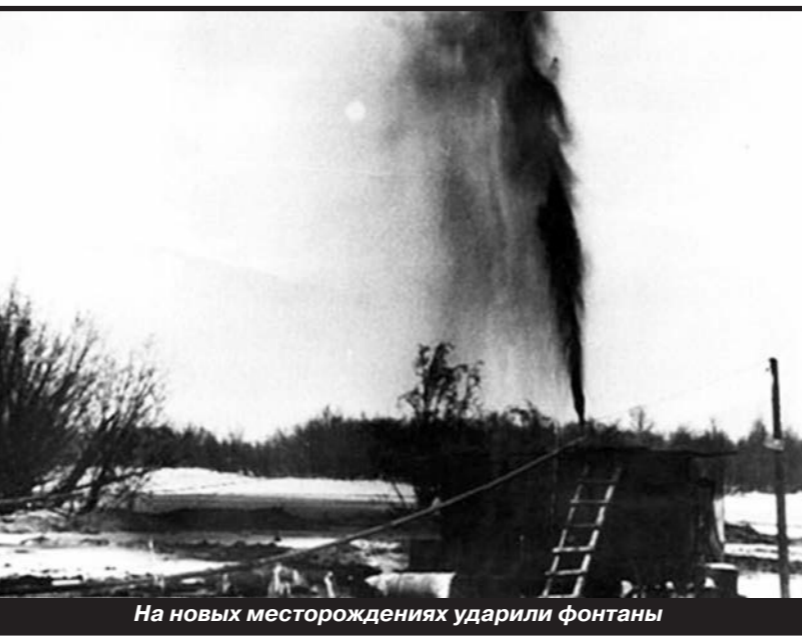
На новых месторождениях ударили фонтаны